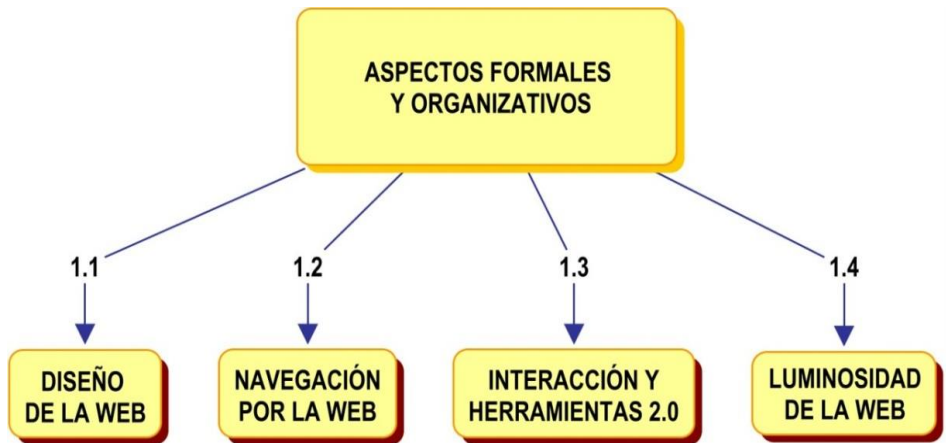
Figura 1. Indicadores del parámetro 1 del modelo de categorización 12-I

Esta propuesta se estructura en dos parámetros y doce indicadores. El parámetro 1 ( Aspectos formales y organizativos ) abarca aquellos aspectos de la web relacionados con su diseño, navegación, interacción y luminosidad, tal como queda recogido en los cuatro indicadores que forman este parámetro y que se explican más abajo: