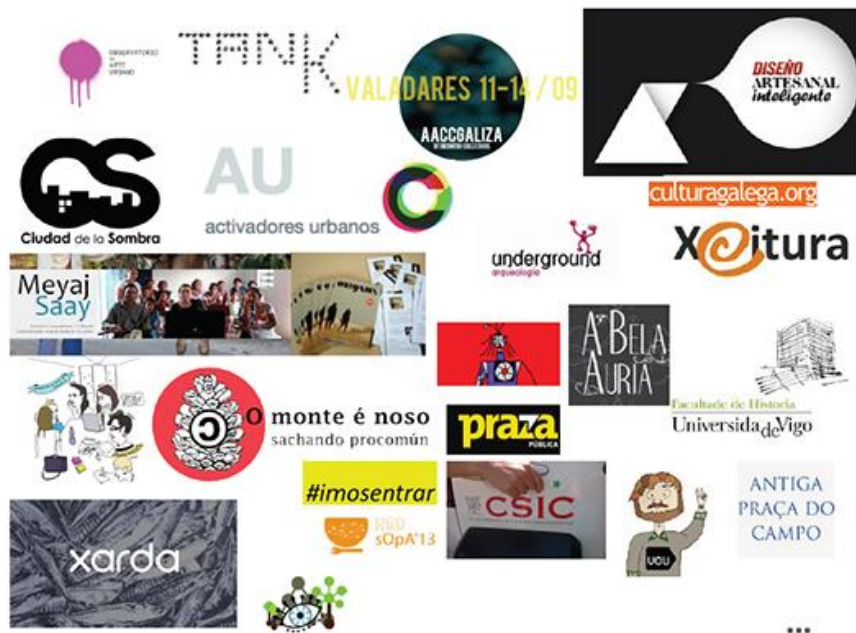
Fig. 7. Mosaico de la red que hemos ido tejiendo

colectivos que han ido aportando tiempo, ideas, cariño, ánimo, destrezas, habilidades pero sobre todo energía para hacer esto posible.